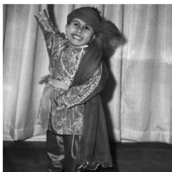
Pun entuzijazma u dobi od četiri godine

Odrastao sam u radničkom gradu s oko pet tisuća žitelja. Blizu oceana. U malenoj kući. Dijete sam dobroćudnih imigranata. Nisam odrastao sa zlatnom žlicom u ustima.