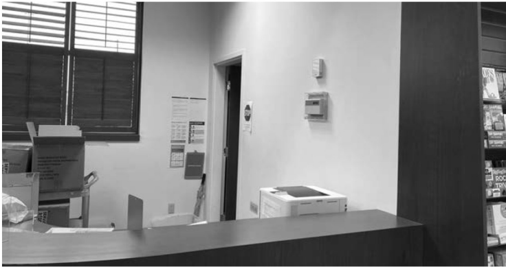
Pult u knjižari

Dok sam se potpisivao, postrance sam uočio promatrača u zelenom baloneru koji je još bio mokar od kiše. Motrio je svaki moj potez.