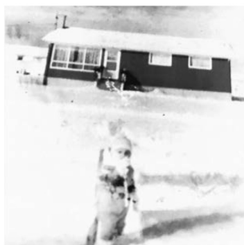
Igram se u snijegu pred kućom

Da, to sam ja u školskoj predstavi. I na našem dvorištu tijekom veoma oštrem zime. Kao što vidite, nemamo Ferrarija na prilazu. Ni traga otmjenim ukrasima i nepotrebnim koještarijama. Sve je vrlo jednostavno. Kako je i najbolje da bude.